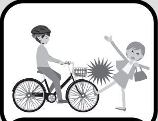
自転車で他人と接触しケガを負わせた