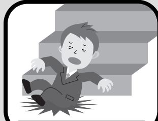
階段から落ちてケガ