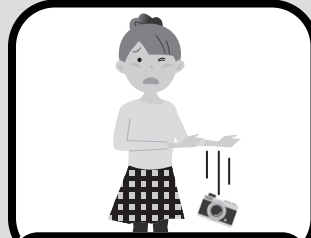
カメラが落ちて壊れた