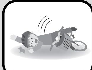
自転車で転倒してケガ