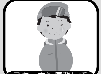
スキー中に遭難して救援を必要とした