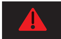
マスターウォーニング