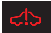
ハイブリッドシステム 異常警告灯