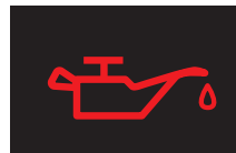
エンジンオイルランプ