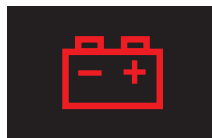
バッテリーランプ